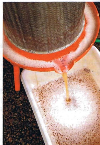
Frukten pressas mot väggarna i cylindern och musten rinner ut.